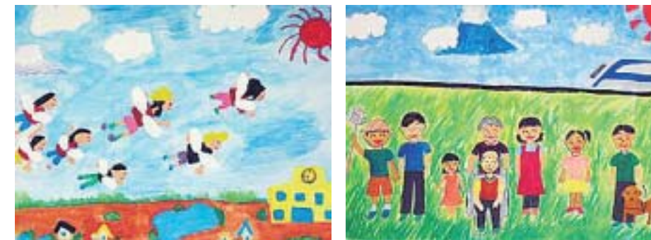
県内小・中学生から募集した「未来の山梨を描こう」より(県立博物館)

今後、県民の皆さまの積極的・主体的な参画を得ながら、この計画を強力に推進していきます。