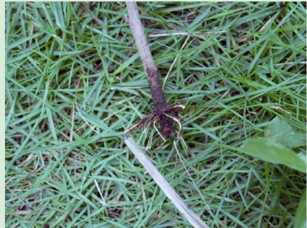
1ヶ月後の発根状態