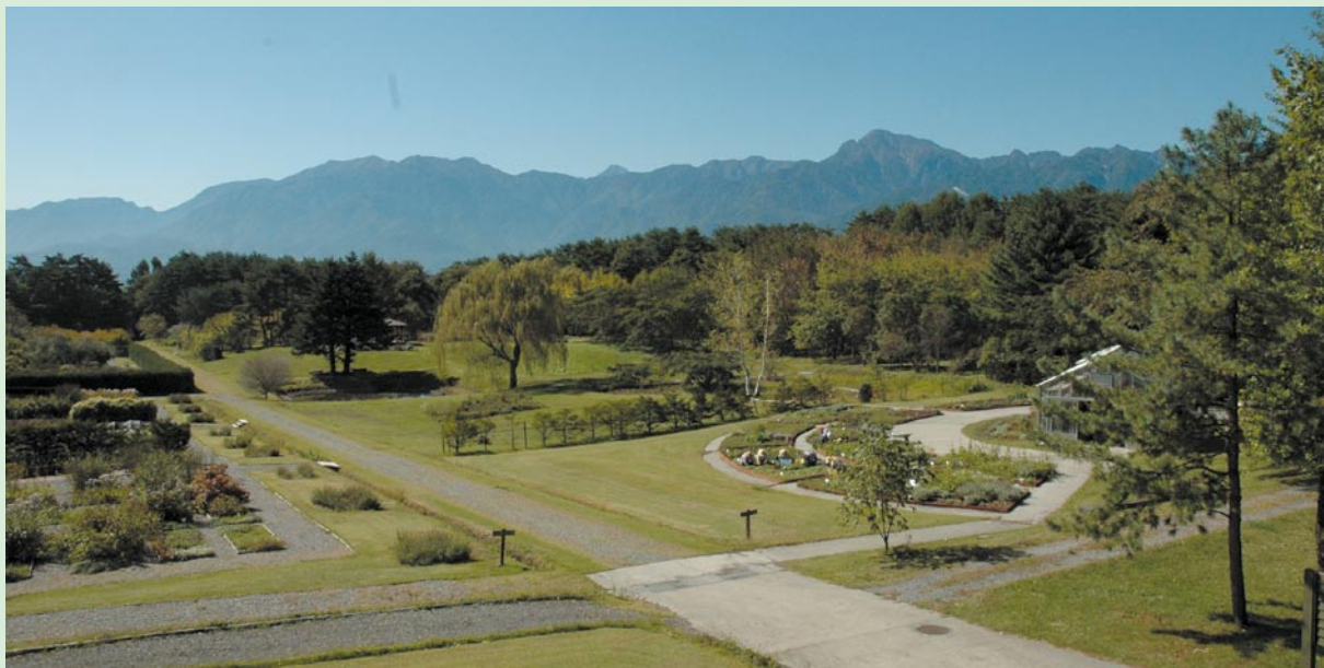
八ヶ岳薬用植物園