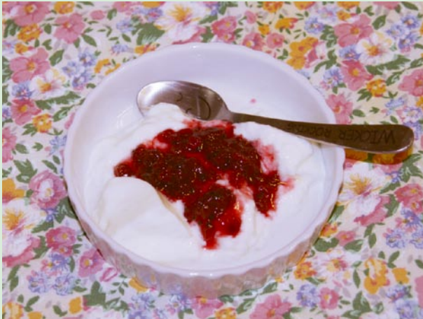
ヨーグルトの フサスグリフルーツソースがけ

フサスグリ1kgに対して600gの砂糖を入れ1時間ほど煮込むとフサスグリのジャムができる。煮込みすぎると色が悪くなるので、色合いを見ながら火加減・時間を調節する。フサスグリのジャムはトースト・パンケーキなどに利用できる。