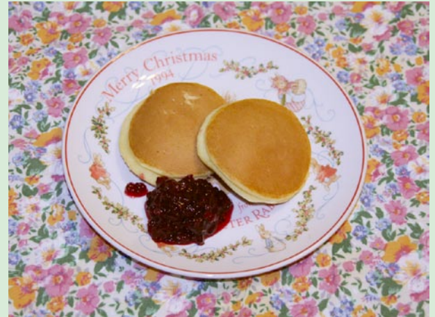
パンケーキのフサスグリのジャム添え