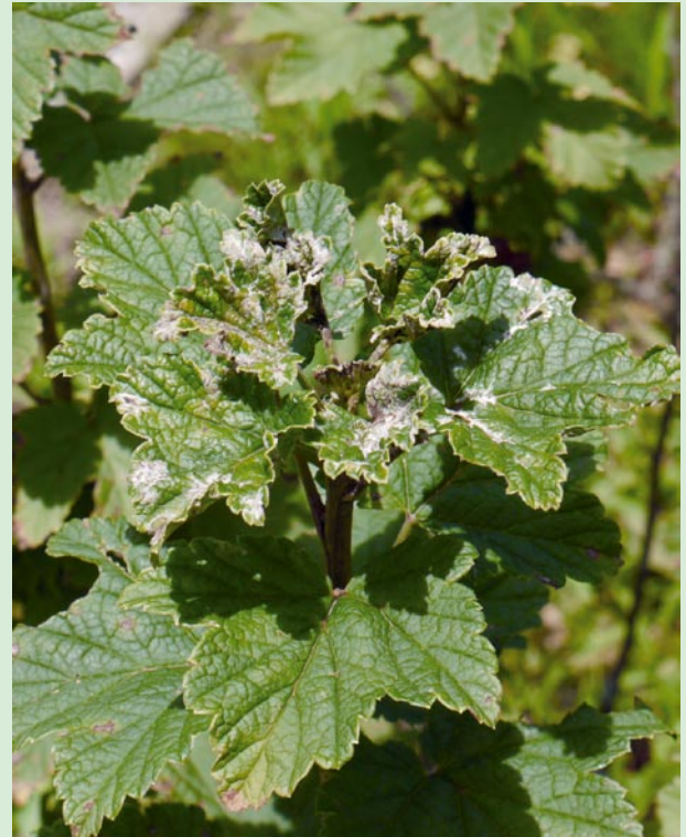
うどん粉病にかかった葉

フサスグリ100gを果実酒用容器に入れ、グラニュー糖500g、ホワイトリカー1.8リットルをいれ、3ヶ月ほどつける。