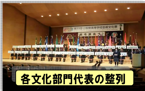
各文化部門代表の整列

なお、本年度は、延べ約2万4千人の生徒が参加し、昨年度より盛会に開催することができたと、実行委員会担当者のお話でした。