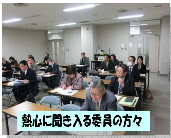
熱心に聞き入る委員の方々

から、「なりたい職業は何か」というようなことから、やれる職業の選択というものが始まります。そうすると、社会との折り合いみたいなものを感じることができます。この時期に必要なスキルというのは、きちんとやったことを報告するとか、時間を守るとか、という当たり前のことです。困ったら誰かが助けてくれるから、困ったことをしっかりと伝えるということが大事になってきます。そして、「将来に向けて必要なことは何か」とか、とにかく成功体験を増やしていくことです。さらに、自分が苦手なことを理解しながら、「困った時には、回りにサポートして貰えばやれるんだ」と、困ったときには「頼ろう」という自信を育てていきます。大切なことは、支援を継続させることです。環境の変化に弱い子どもだからです。