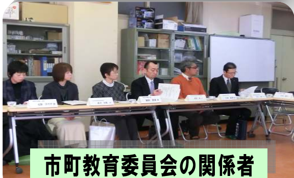
市町教育委員会の関係者

この会は、甲府市を除く、中北地区の特別支援教育・地域療育関係者30名が、「地域内のネットワーク形成・研修・情報提供・相談支援システム構築」を目的に、協議を行うものです。多くの参加者のもと、活発な意見交換が行われました。