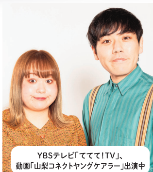
YBSテレビ「ててて!TV」、 動画「山梨コネクトヤングケアラー」出演中