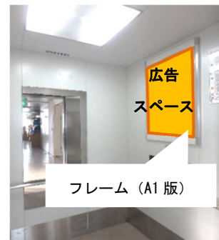
北別館エレベーター内

1階：カフェ・研修室（生涯学習）・ジュエリーミュージアム・オープンスクエア（多目的会場）有