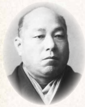
あめ みや けい じ ろう 雨宮 敬次郎 Keiji Amemiya

日本の近代化のあゆみは鉄道とともにありました。より速く、大量に、日本の社会を大きく変えて来たその150年の歴史には、多くの人々の叡智と情熱が刻まれています。そのような日本の鉄道の発展の物語のなかには、さまざまな山梨の鉄道人たちの綺羅星のごとき輝きをみることができます。彼らの夢が人々の喜びへと変わるまで、山梨の鉄道人たちの足跡とその思いを追いかけてみましょう。