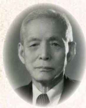
こ ばやし いち ぞう 小林 一三 Ichizo Kobayashi

(南アルプス市 1874~1959) 富士身延鉄道、山梨交通といった山梨にゆかり深い企業の要職を務めた。芸術への造詣が深く、根津美術館の理事長・館長も務めた。