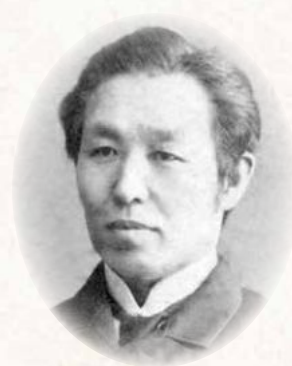
わた なべ せい しゅう 渡辺 青洲 Seishu Watanabe

(南アルプス市 1820~1913) 行商生活から一代で、東京の電力や市電を支配するほどの財をなした。政界でも初代甲府市長や、山梨最初の貴族院多額納税者議員に就いている。