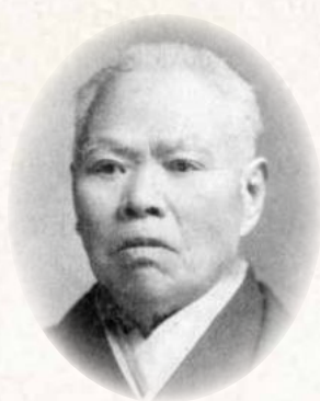
わか お いっ ぺい 若尾 逸平 Ippei Wakao

(笛吹市 1870~1944) 富士山麓の観光開発を構想し、富士山麓電鉄(現在の富士急行)を実現した。「富士五湖」の名称を広めた人物とも言われている。