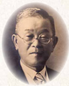
ね づ か いち ろう 根津 嘉一郎 Kaichiro Nezu

(韮崎市 1873~1957) 沿線宅地開発や百貨店など、鉄道の多角経営のスタイルを生み出した阪急電鉄創業者。宝塚歌劇団・東宝などの文化芸術事業も創立している。