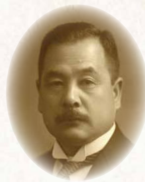
はや かわ のり つぐ 早川 徳次 Norisugu Hayakawa

(山梨市 1860~1940) 東武鉄道など全国の鉄道経営に手腕を発揮し、「鉄道王」と呼ばれた。県内全小学校へのピアノや教材の寄贈、県立図書館まるごとの寄付など、教育にも足跡を残した。