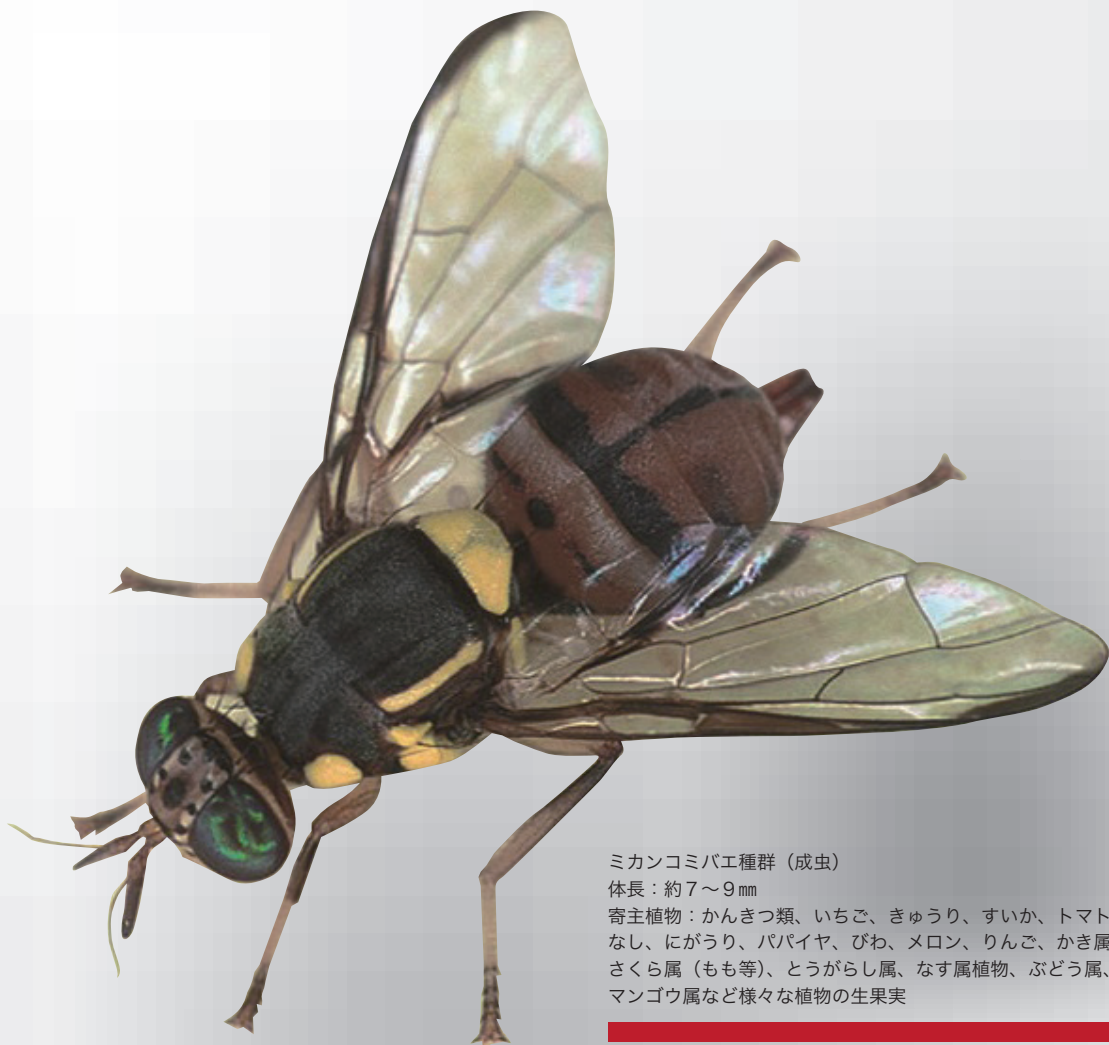
ミカンコミバエ種群（成虫）

みなさまが、農作物に見慣れない症状がある、普段と同じ防除をしているのに病害虫の被害が収まらないなどの、普段とは異なる農作物被害や見慣れない病害虫を見つけたときは、最寄りの指導機関、都道府県の病害虫防除所または農林水産省植物防疫所等にお知らせください。