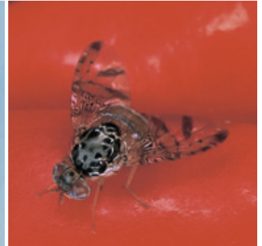
チチュウカイミバエ