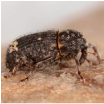
イモゾウムシ成虫