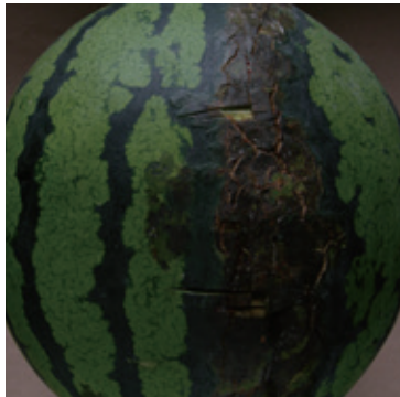
スイカ果実汚斑細菌病