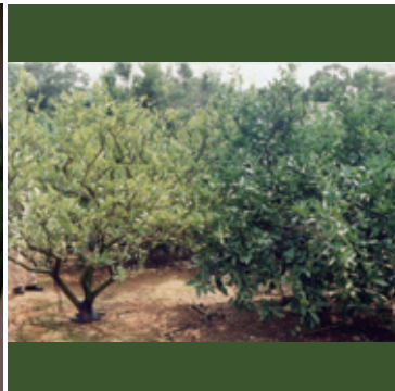
カンキツグリーンング病 (左：感染樹、右：健全樹)