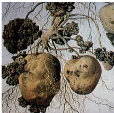
ジャガイモがんしゅ病