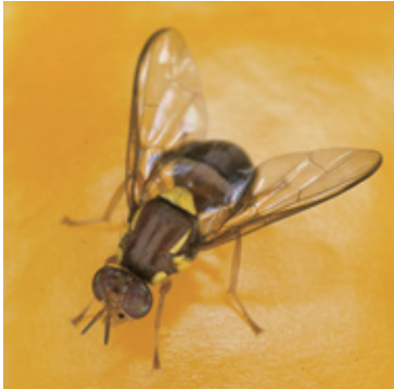
クインスランドミバエ