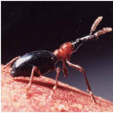
アリモドキゾウムシ