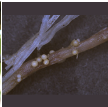
ジャガイモシストセンチュウ (ジャガイモの根に寄生するシスト)