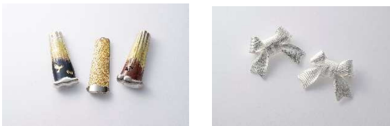
ブローチ／飯野一朗