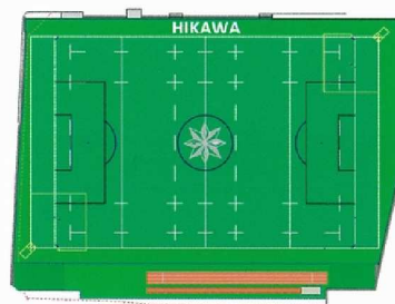
グラウンドレイアウト (イメージ)