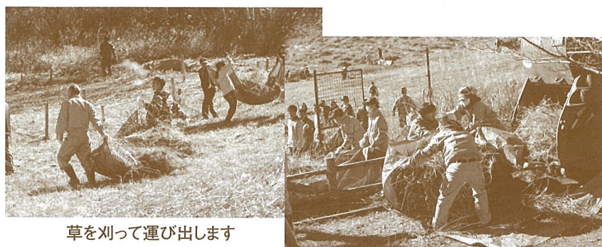
草を刈って運び出します