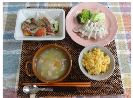
designed by freepik.com